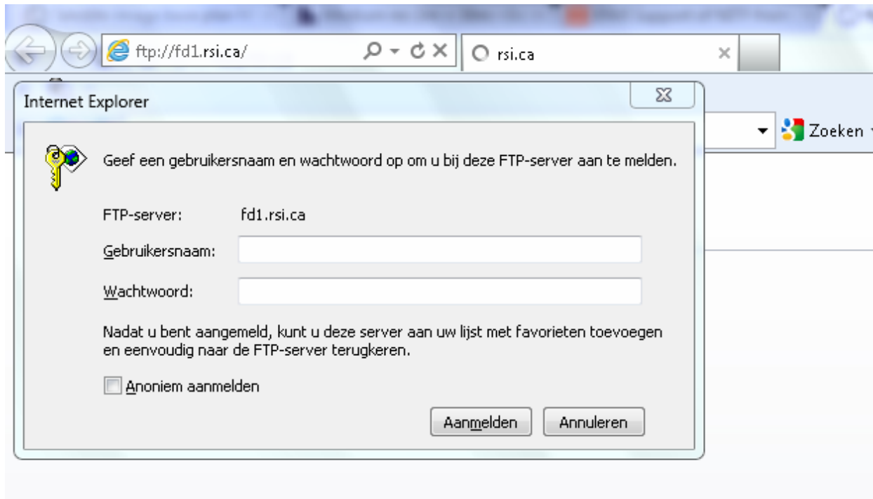
Figuur 2: Login scherm

Gebruikt u een webbrowser dan wordt vervolgens gevraagd uw login-gegevens in te vullen (zie figuur 1).